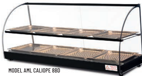
MODEL AML CALIOPE 8BD