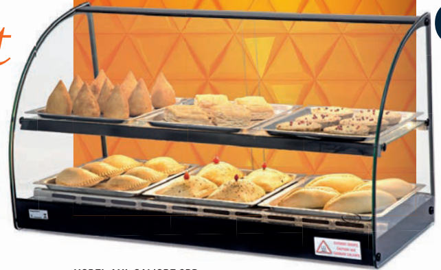
MODEL AML CALIOPE 6BD

• Clean design with 360° vision and all tempered glass of high quality. • Internal LED lighting on the top and bottom that helps to highlight more the exposed products. • Stainless steel trays to store different types of warm foods. • Sliding glass doors. • Side glasses with serigraphy treated thermally that resists high temperatures. • Anodized aluminum front frame*. • It has an adjustable thermostat that allows food to be kept at an ideal temperature. • Tough stainless steel base. • NEMA 5-15P