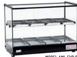
MODEL AML EVR 8BD