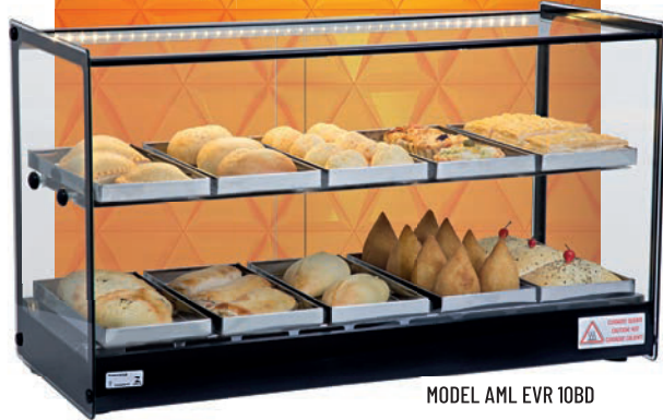
MODEL AML EVR 10BD