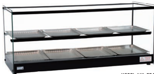
MODEL AML ERATO 8BD