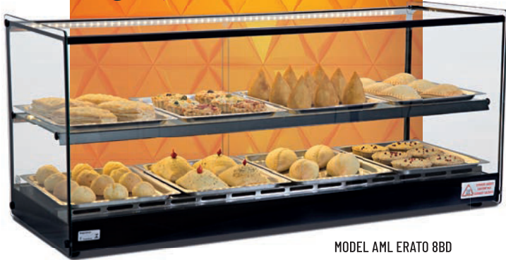
MODEL AML ERATO 8BD