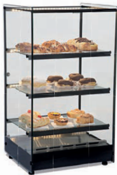
MODEL AML ERATO TOWER DRY

• Clean design with 360° vision and all tempered glass of high quality. • Led internal lighting in the upper part and in the shelf that help to highlight more the exposed products. • Stainless steel trays to store different types of hot foods. • Sliding glass doors. • Side Glasses with serigraphy treated thermally resistant to high temperatures. • Anodized aluminum front. • With adjustable thermostat to keep food exposed at the ideal temperature. • Rugged stainless steel base. • NEMA 5-15P