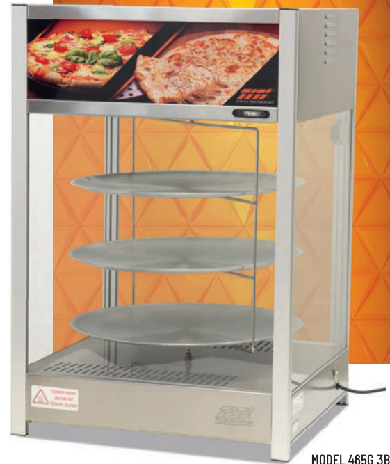
MODEL 465G 3B