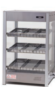
MODEL 476 SD 9B