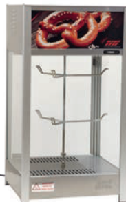
MODEL 463 G PRETZEL